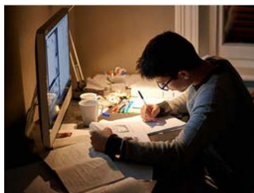
Stanza non illuminata e oggetti non autorizzati