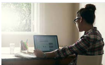
Dispositivo mobile posizionato di traverso/di spalle