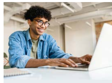
Dispositivo mobile posizionato troppo vicino e non laterale