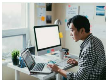
Utilizzo secondo monitor e oggetti non autorizzati