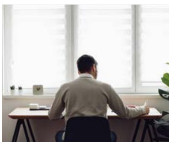
Dispositivo mobile posizionato alle spalle